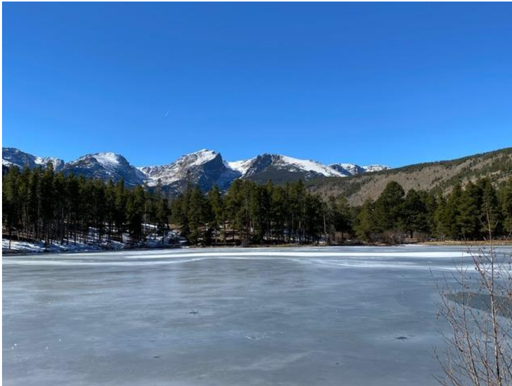
Hình Hồ Sprague tại công viên quốc gia Estes

Rồi ngắm nhìn các băng tuyết trắng xóa vừa mới tạo thành gần đây trên các dãy núi cao vút, cũng như cái hồ nước “Sprague lake” 1